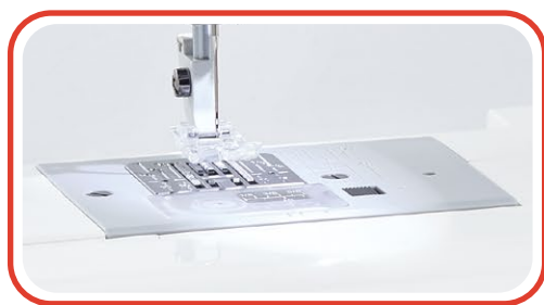
Bobina horizontal anti-enredos