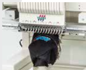
▲ Gorras Wide