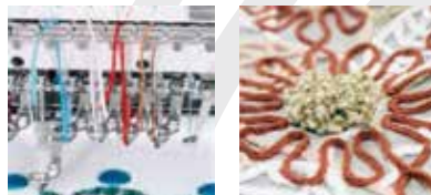
Bordado con 6 tipos de cordones diferentes