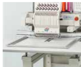
▲ Bastidor Plano