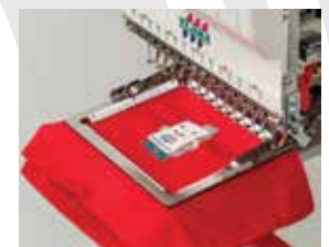
▲ Bastidor de Aire

INCLUYE • Instalación y capacitación • Garantía por 6 meses en mano de obra (Servicio Técnico)