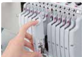
Guía de hilo medio

INCLUYE • Instalación y capacitación • Garantía por 6 meses en mano de obra (Servicio Técnico)