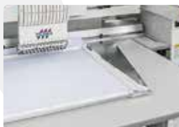
Bastidor Plano reforzado