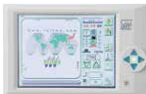
Panel de Operación Touch