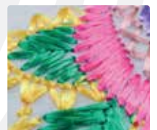
Mejor estabilidad y calidad del bordado

Casa Díaz Matriz: Fray Servando Teresa de Mier No. 29 Col. Obrera Cd. de México Tel. 01 (55) 57649090