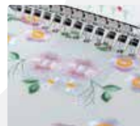
Fácil de enhebrar