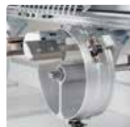
Bastidor Gorras Ancho reforzado