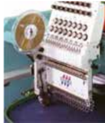
APARATO DE LENTEJUELA