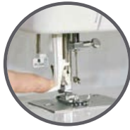
Ensartador semi-automático de aguja