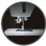
Luz blanca LED

Funda cubre máquina, prensatela para ojal, cierre, botón, guía de costura, carretes, agujas, desarmador, aceite, brocha y descosedor.