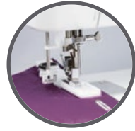
Ojal automático en 1 paso