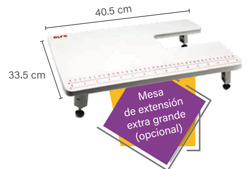
Mesa de extensión extra grande (opcional)