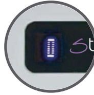
Visor de puntada BackLight LED